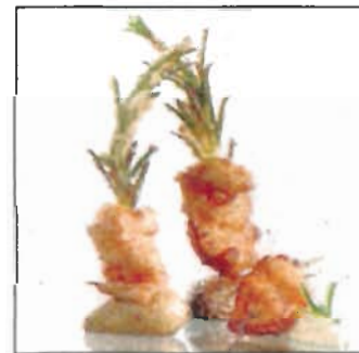
Meerforellenspieße in Bierteig.

• Kleine Kartoffeln bei 170 Grad gar frittieren, Fischstreifen pfeffern, salzen und danach auf einen Rosmarinzwweig stecken und in Bierteig eintauchen. Spieße bei 170 Grad frittieren bis der Teig braun ist. Kartoffeln gerade schneiden, Spieße darauf stecken. Mit Remoulade oder Mayonnaise servieren. (thr)