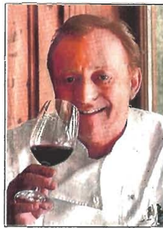
Alfons Schuhbeck, Koch und Bayer aus Leidenschaft.